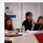
Asamblea Universitaria 2010